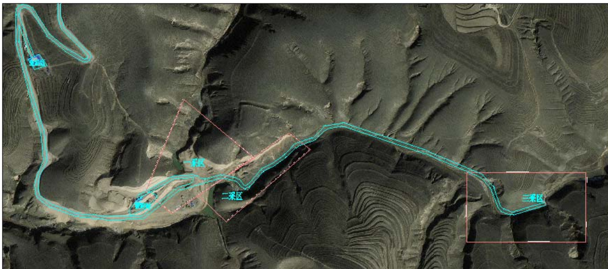
图 7-1 矿山总平面布置示意图

矿山由采矿场、工业场地、矿山道路等几部分组成。见图 7-1 矿山总平面布置示意图。