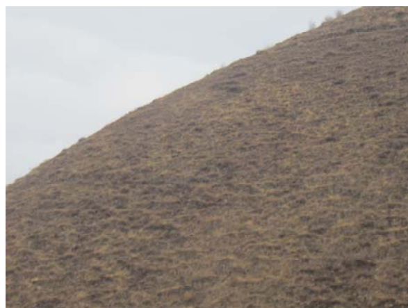
照片 2 原始地貌