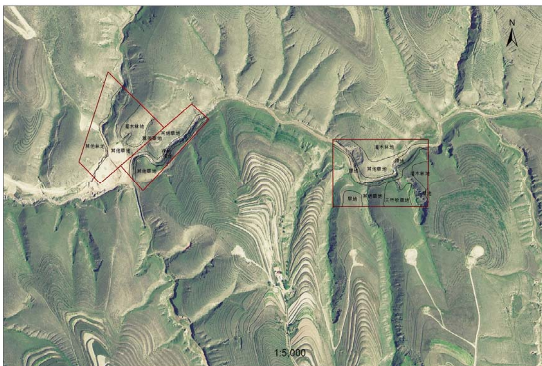
矿山土地利用类型图