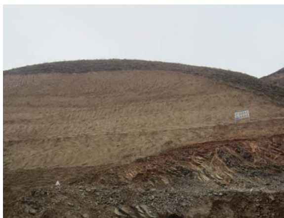
照片 1 采场现状

矿山为改建项目，一采区为原采矿权范围，已进行了开采，形成一个不规则采坑，采坑边坡高 10-30 米，边坡角为 60°左右。二、三采区范围内为原始地形，未进行开采。见照片 1 采场现状和照片 2 原始地貌。